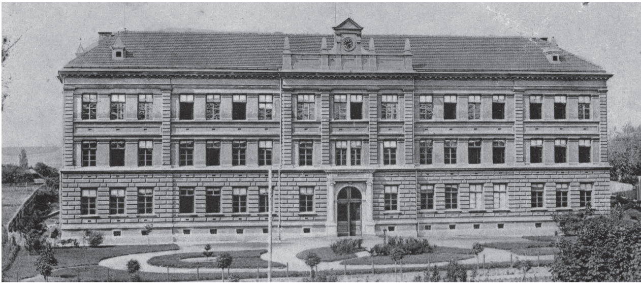
Szkoła żeńska w Tarnowie