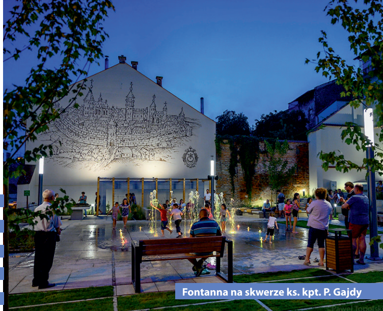
Fontanna na skwerze ks. kpt. P. Gajdy