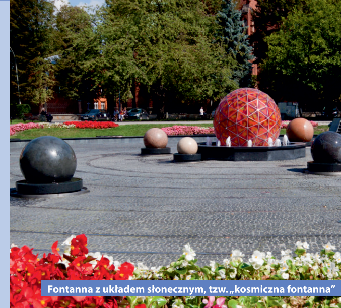
Fontanna z układem słonecznym, tzw. „kosmiczna fontanna”