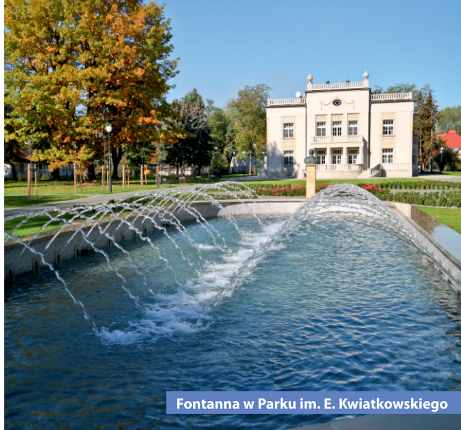
Fontanna w Parku im. E. Kwiatkowskiego