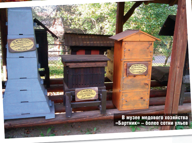
В музее медового хозяйства «Бартник» — более сотни ульев

Яркий пример — медовое хозяйство «Бартник» в поселке Струже. Тут есть и мини-отель, и уникальный музей с более чем сотней ульев — от самых древних до ультрасовременных, и «Медовая школа», где вам прочитают увлекательнейшую лекцию о пчелах и меде, а еще научат собственноручно изготавливать