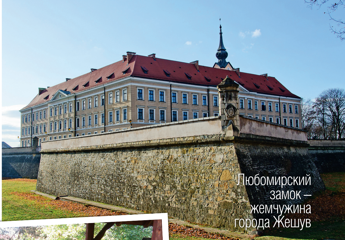
Любомирский замок — жемчужина города Жешув

Практически в каждом городке Малой Польши есть свой музей