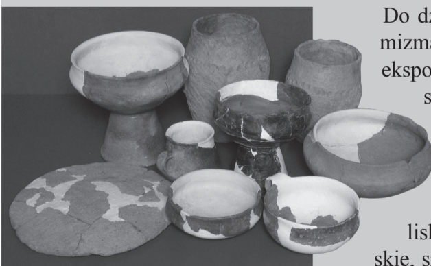
Naczynia kultury lużyckiej z badań w Gorzycach

Najbardziej interesującą część zbiorów numizmatycznych stanowią skarby. Muzeum tarnobrzeżskie posiada ich cztery, w tym dwa znalezione podczas wykopalisk na Górze św. Marcina. Są to monety polskie, szwedzkie i pruskie od późnego średniowiecza po rok 1663.