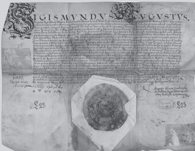
Przywilej Zygmunta Augusta na rzecz mieszczan tarnobrzeżan, Warszawa, 20 kwietnia 1572

Przykładem może być ciesząca się dużym zainteresowaniem wystawa czasowa „To właśnie Tarnobrzeg - Wielcy Tarnobrzeżanie”, ukazująca dzieje miasta i regionu w „pigułce”, od czasów prehistorycznych po okres międzywojenny.