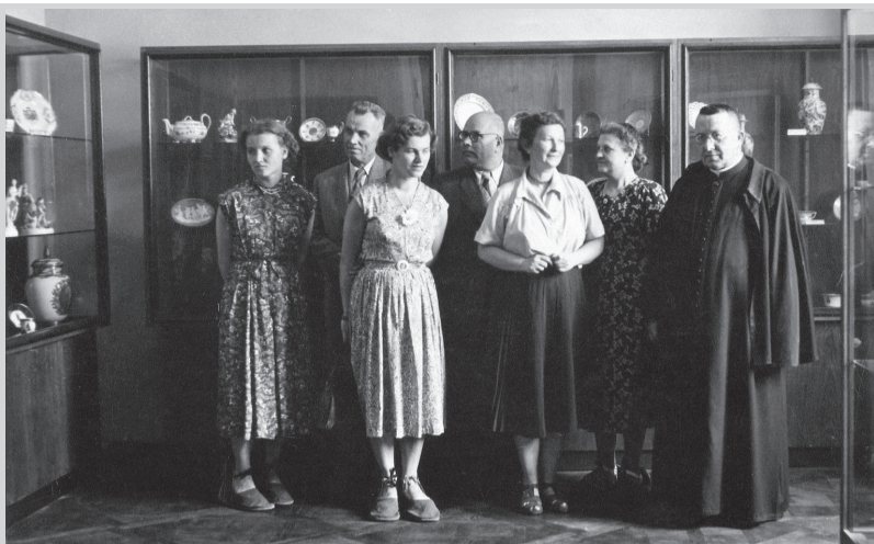
Otwarcie pierwszej wystawy czasowej w Muzeum w Tarnowie w 1931 r.

Dział historii zajmuje się także organizacją wystaw oraz różnego rodzaju wydarzeń kulturalnych.