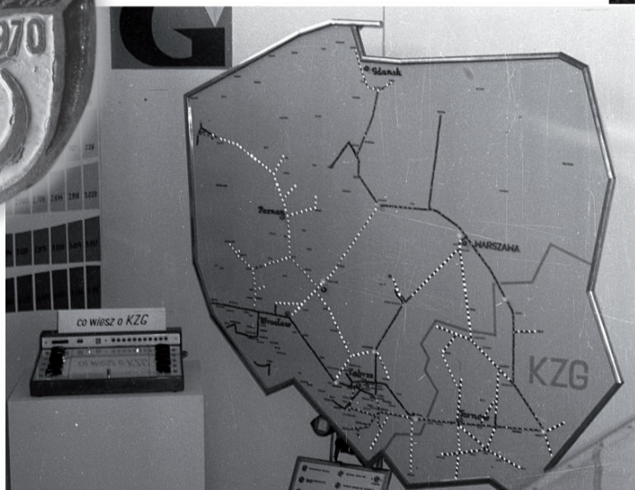
Wystawa osiągnięć przemysłu województwa tarnowskiego miała miejsce w trakcie Dni Tarnowa 76. 10.06.1976