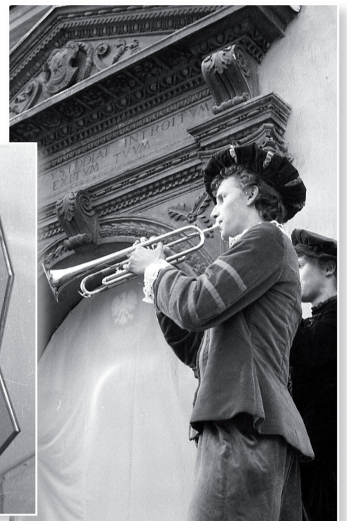
Dni Tarnowa 1988 - inauguracja na stopniach Ratusza.