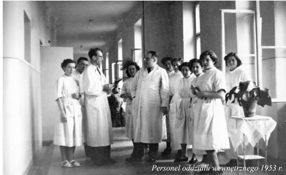
Personel oddziału wewnętrznego 1953 r.