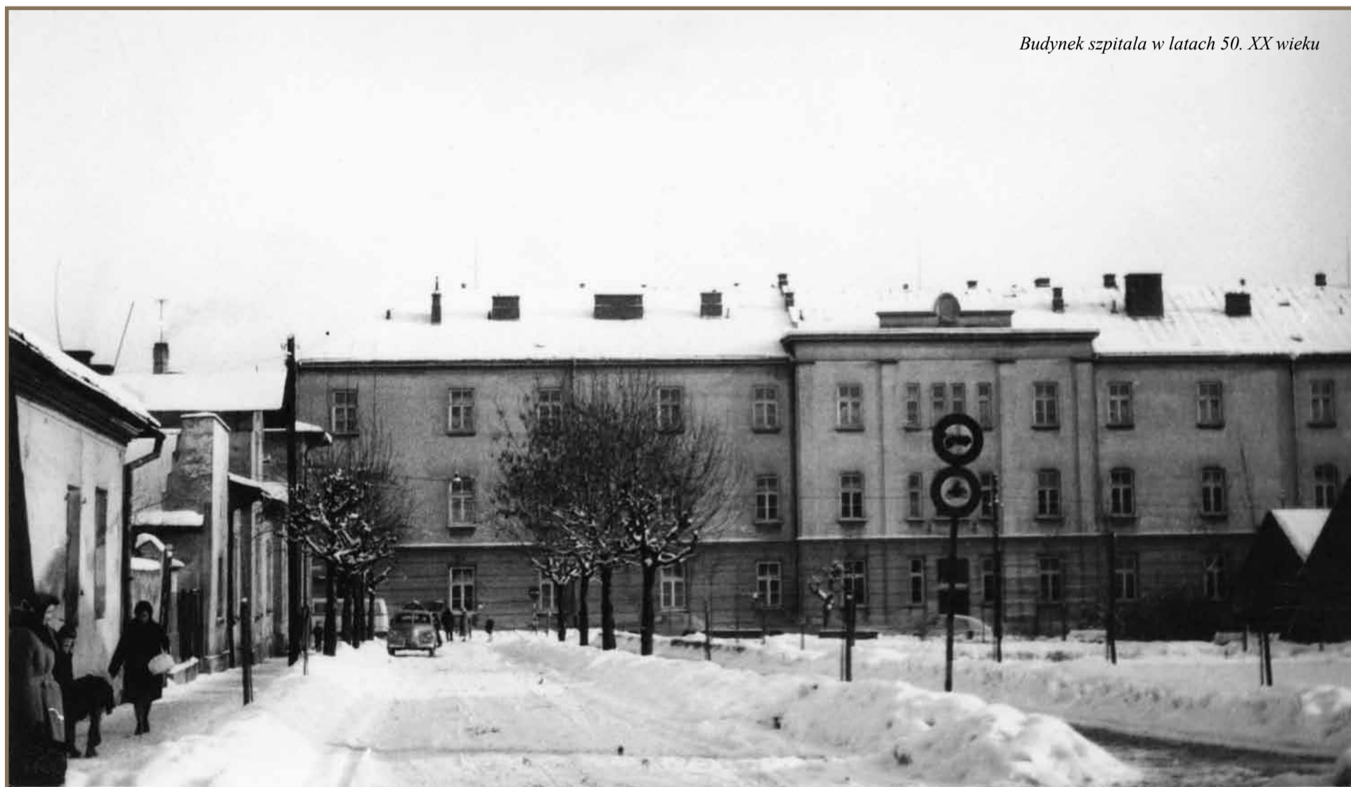
Budynek szpitala w latach 50. XX wieku

Niewiele jest szpitali w Polsce, które mogą szczycić się 180-letnią historią działalności. To okres, w którym w medycynie zmieniło się prawie wszystko – od sposobów leczenia, poprzez postęp wiedzy specjalistycznej, rozwój technologii medycznych, technik operacyjnych itd.