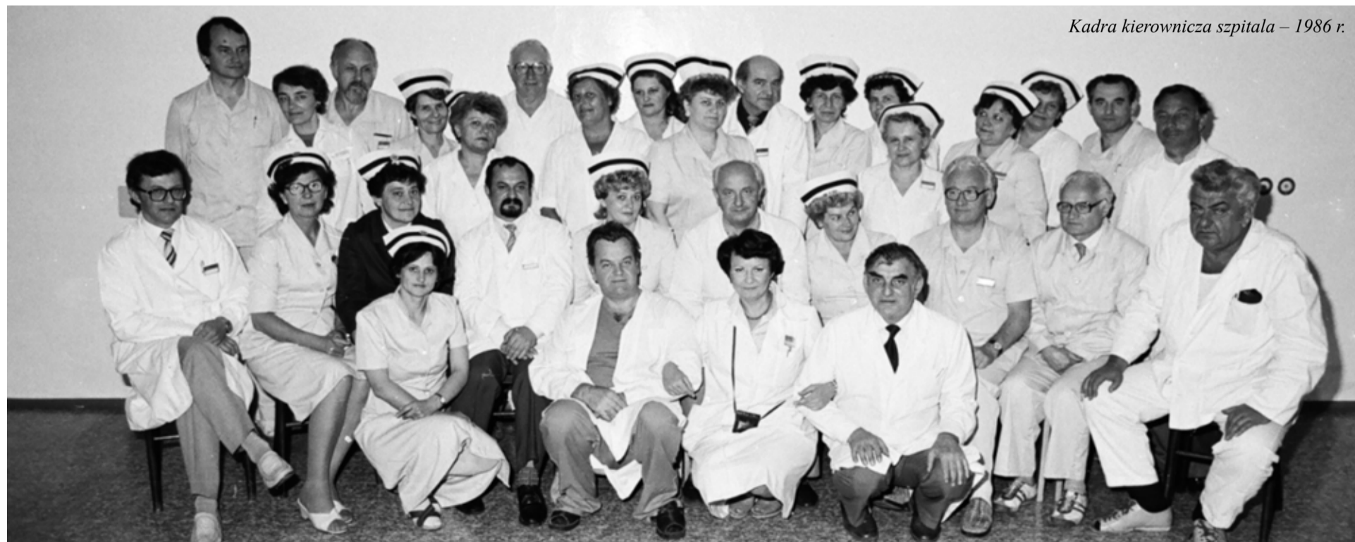
Kadra kierownicza szpitala – 1986 r.

W latach 60-tych szpital rozpoczął działalność dydaktyczno-naukową, stwarzając możliwość uzyskania specjalizacji lekarzy w podsta-