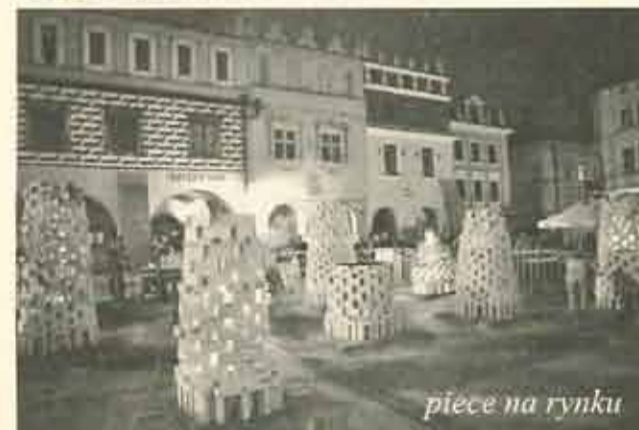
piece na rynku

15-31 sierpnia - Plenerowy wypał rzeźb w piecach węgierskich, koncerty, performance i projekcje filmowe na Rynku i wystawy - -Strefa Żywiolów