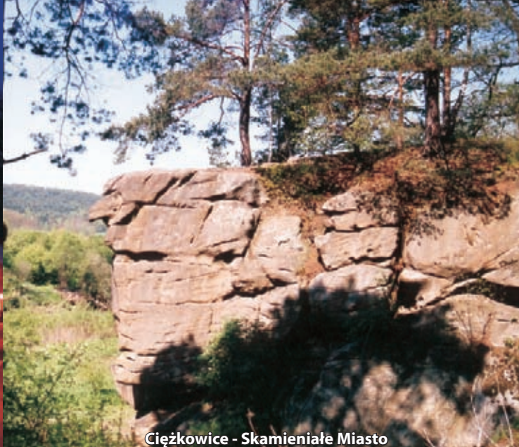
Ciężkowice - Skamieniałe Miasto