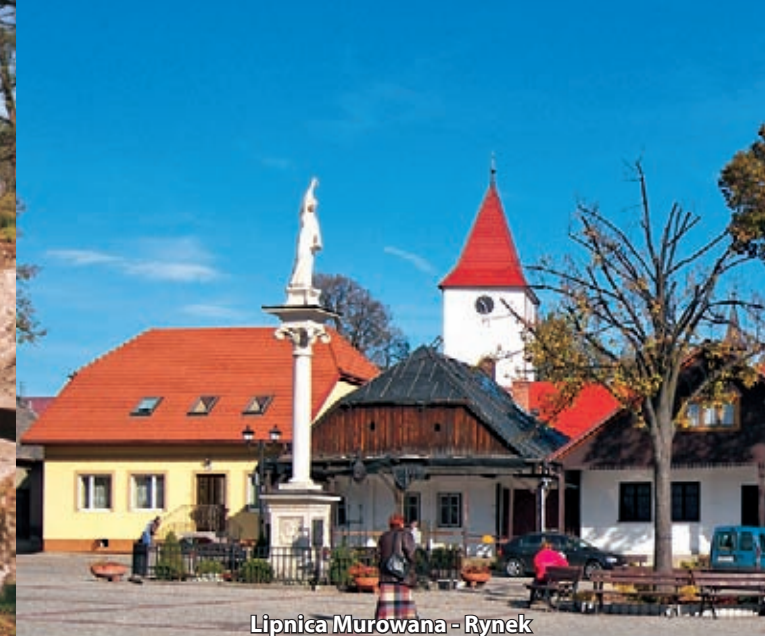
Lipnica Murowana - Rynek

Najstarsze informacje na temat Ciężkowic znajdują się w datowanym na lata 1123-1125 dokumencie biskupa Idziego, zatwierdzającym posiadłości klasztoru tynieckiego. Osada otrzymała prawa miejskie w 1348 roku, aktem lokacyjnym króla Kazimierza Wielkiego. Do dzisiejszego dnia zachował się średniowieczny układ miasteczka z obszernym prostokątnym rynkiem i parami wybiegających z naroży ulic. Specyficzny klimat Ciężkowic tworzą otaczające rynek zabytkowe, murowano-drewniane domy z podcieniami z XVIII i XIX w. Są to budynki konstrukcji zrębowej, na podmurówce i fundamentach z miejscowego piaskowca, z siodłowymi, naszczołkowymi dachami, wspartymi na profilowanych drewnianych słupach, tworzącymi charakterystyczne podcienia. Wraz z usytuowanym pośrodku rynku dziewiętnastowiecznym, murowanym ratuszem z niewielkim wewnętrznym dziedzińcem i wieżyczką zegarową nadają miastu wyjątkowy urok. Odwiedzając Ciężkowice nie sposób ominąć jedynego w swoim rodzaju rezerwatu przyrody „ Skamieniałego Miasta ”. Na obszarze 15 hektarów znajdują się liczne grupy skał z piaskowca ciężkowickiego, którym natura nadała niezwykle kształty. Rozrzucone na wzgórzu małe i duże formy skalne sprawiają wrażenie ruin dawnego grodu.