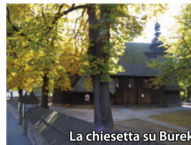
La chiesetta su Burek