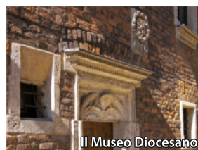
Il Museo Diocesano