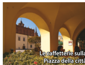
Le caffetterie sulla Piazza della città