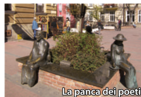
La panca dei poeti