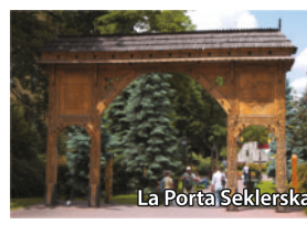
La Porta Seklerska