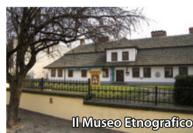
Il Museo Etnografico