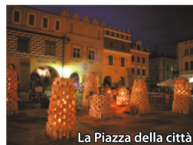
La Piazza della città