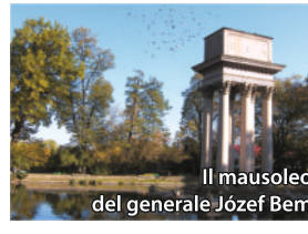
Il mausoleo del generale Józef Bem