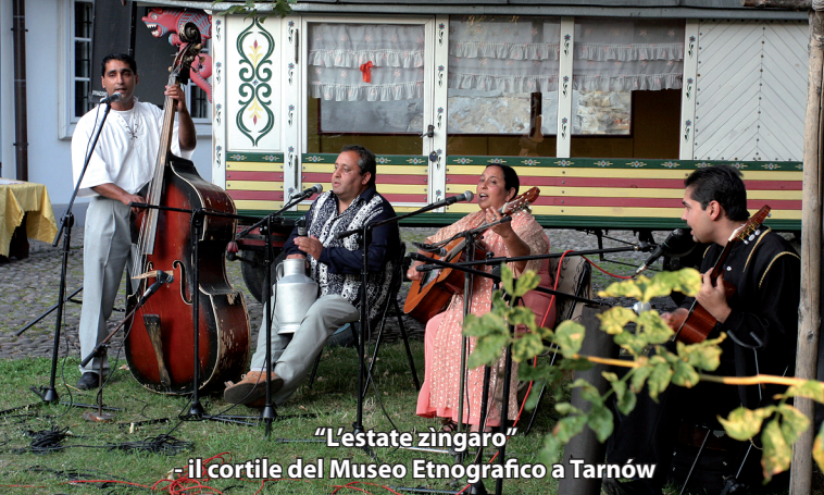
"L'estate zingaro" - il cortile del Museo Etnografico a Tarnów