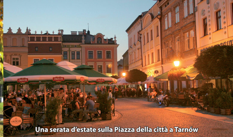
Una serata d'estate sulla Piazza della città a Tarnów

Per tutti coloro che hanno voglia di trascorrere alcuni giorni a Tarnów, proponiamo il seguente programma. Se siete interessati vi preghiamo di verificare gli orari di apertura nelle varie strutture culturali. Lo si può fare direttamente sul posto oppure nel Centro per il Turismo di Tarnów (TCI)