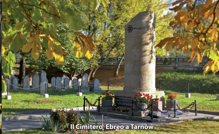
Il Cimitero Ebreo a Tarnów