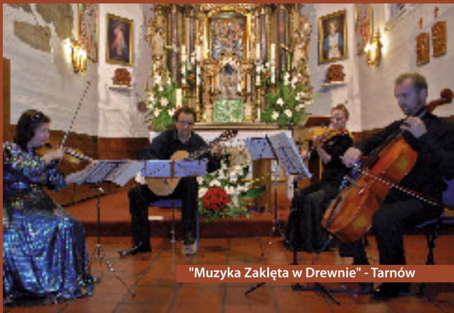
"Muzyka Zaklęta w Drewnie" - Tarnów