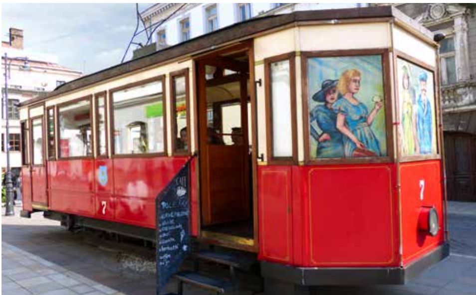
Een koffiebar in Tarnow: net een ietsje anders ...