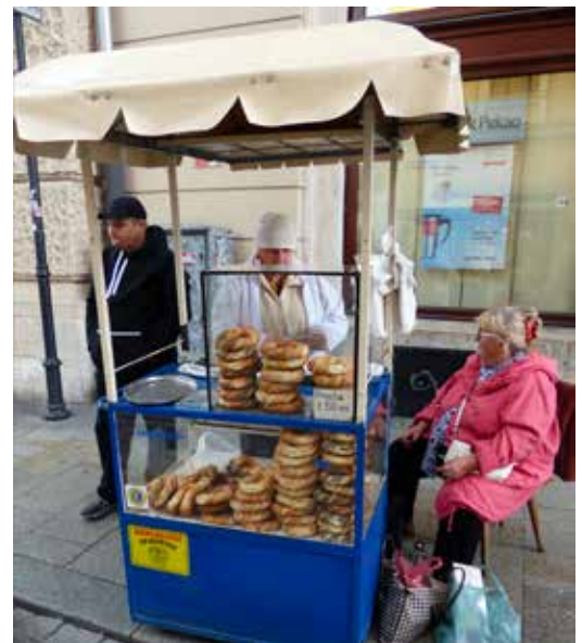
Pretzelstalletjes tieren welig in Krakau.