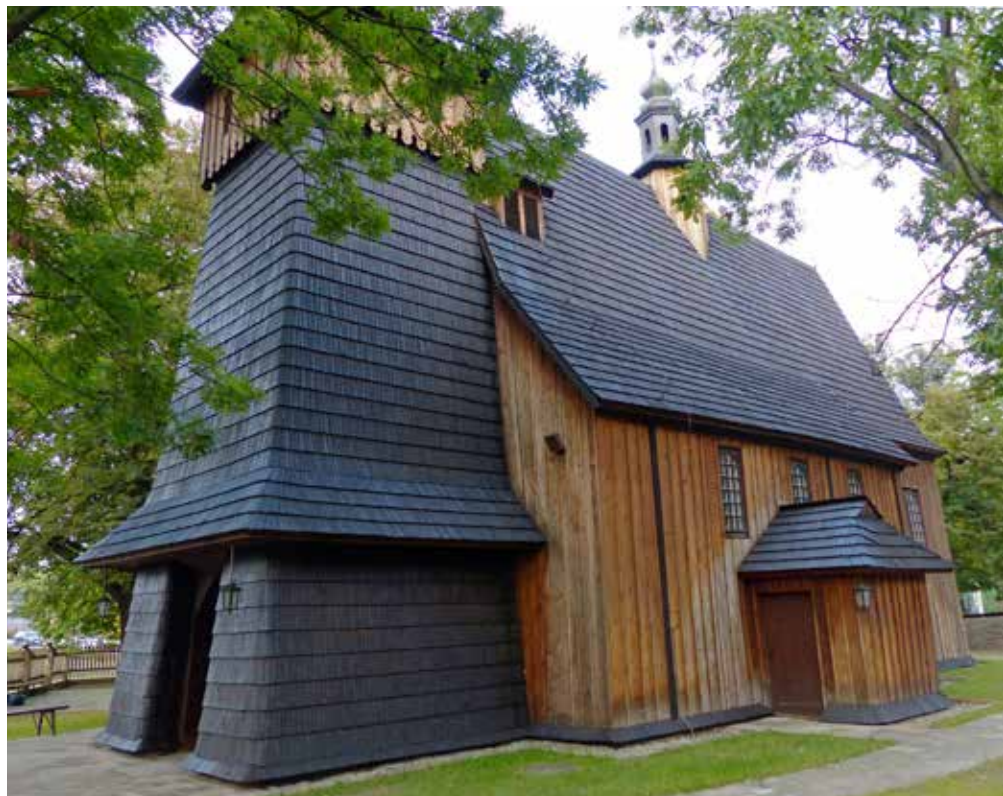
Na Burku, het stemmige houten kerkje van Tarnow.