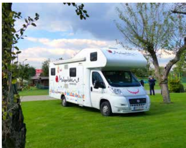
De toeristische diensten van Malopolska maken op een originele manier publiciteit voor hun regio. Als kampeerders kunnen we dit best waarderen.