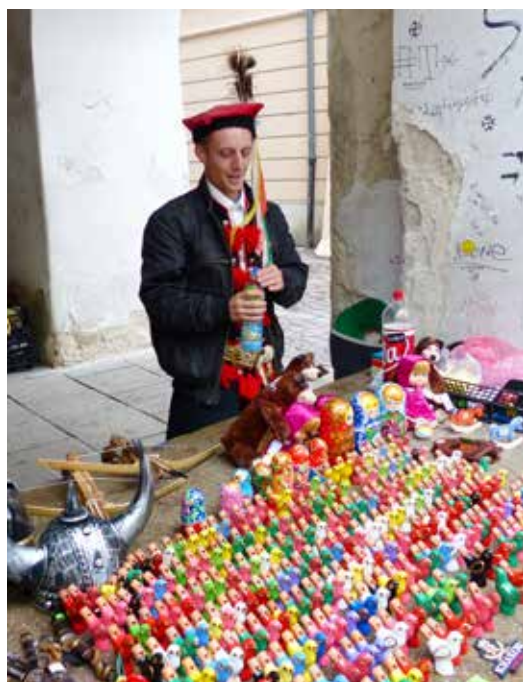
Hier in Krakau koop je geen fluitje van een cent, maar eentje van een zloty.

In de 12de eeuw schreef een zekere Muhammad al-Idrisi over Krakau: "Het is een mooie stad met vele huizen, markten, wijngaarden en tuinen." Een andere beschrijving uit dezelfde eeuw had het over "een hoofdstad die uitblinkt boven alle andere Poolse steden". Rekening houdend met de dichtertelijke vrijheid kunnen we ons perfect aansluiten bij deze citaten. ■