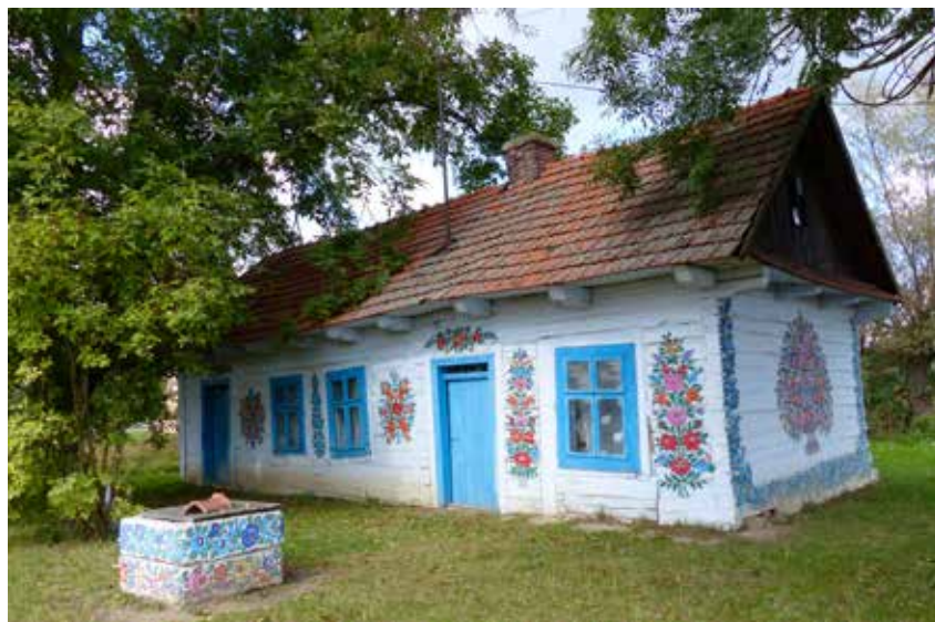
Beschilde huisjes geven het dorpje Zalipie faam en kleur.