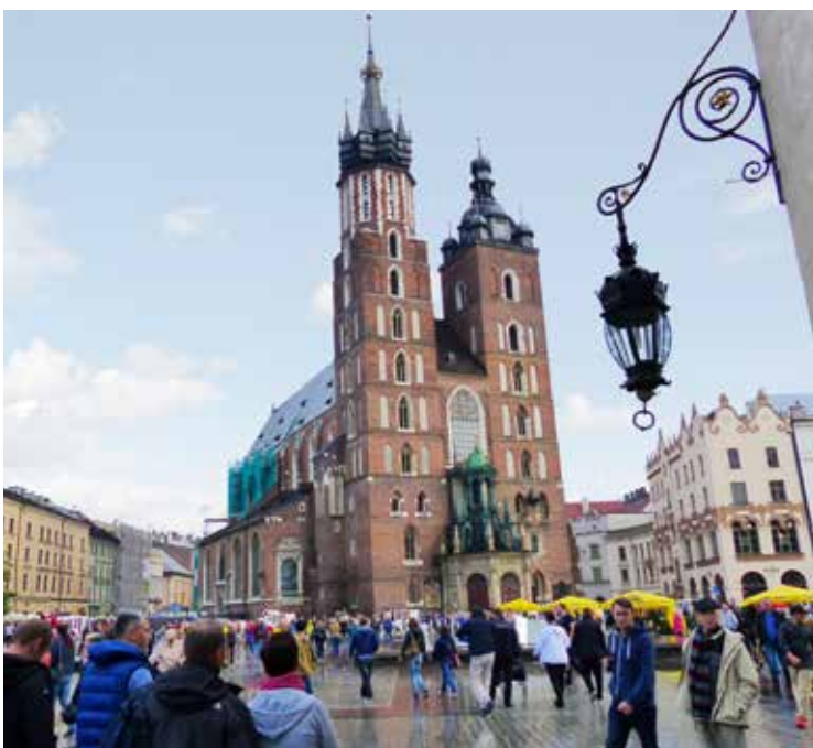
De gotische Maria-Hemelvaartkerk bekijkt onbewogen de massa bezoekers op de Rynek Glowny.