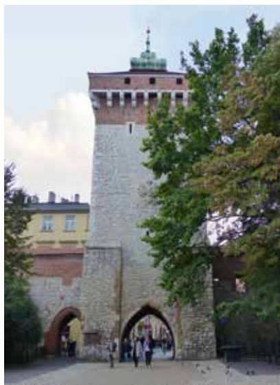
De Florianuspoort dankt haar overleving aan een 'rokkenhistorie'.

100.000 universiteitsstudenten staan borg voor een jonge en energieke sfeer. Krakau bruist de hele dag tot in de vroege uurtjes. Een uitgebreide activiteitenkalender biedt een waaiër van festivals, concerten en culturele evenementen aan, zodat niet het aanbod, maar de keuze een probleem vormt. Krakau bezoeken betekent kiezen, en kiezen is altijd een beetje verliezen. Natuurlijk zijn er die onvermijdelijke 'highlights', waar elke reisgids je naartoe leidt. Het echte Krakau heeft echter meer in zijn mars. Wil je een goed beeld van de stad krijgen en de echte sfeer opsnuiven, dan is een dag te kort. In Krakau telt een dag altijd te weinig uren.