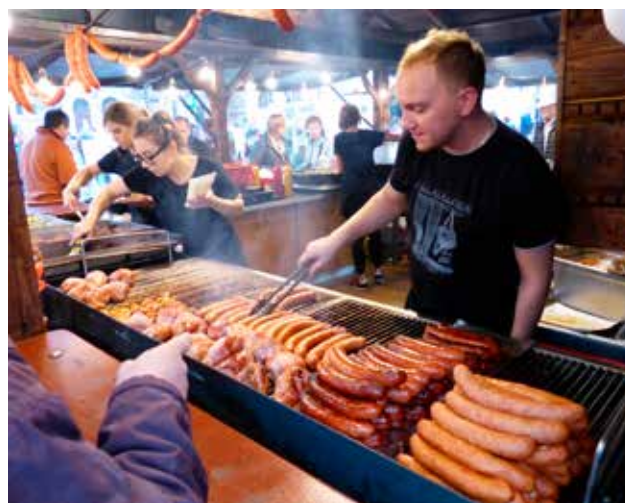
In Polen wordt stevige kost geserveerd.