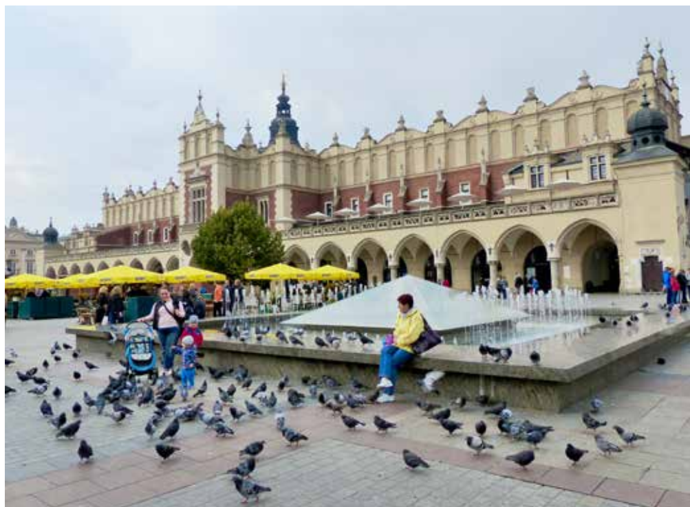
Centraal op de Grote Markt pronken de Sukiennice, de gebouwen van de vroegere lakenhallen.

Koning Casimir of Kazimierz de Grote wou, zoals elke monarch trouwens, zichzelf graag vereeuwigd zien. Bijgevolg stichtte hij in 1335 op loopafstand van zijn paleis een nieuwe stad die zijn naam zou dragen. De man kon toen onmogelijk vermoeden dat er in het midden van de 20ste eeuw dramatische gebeurtenissen zouden plaatsvinden in zijn Kazimierz. Vanaf eind 15de eeuw was de nieuwe stad een aantrekkingspool voor de Joden en al snel ontwikkelde er zich een stad binnen de stad. De Tweede Wereldoorlog betekende echter een catastrofe voor de Joodse gemeenschap. Haast niemand overleefde de Holocaust. Kazimierz kreeg een ereplaats in de geschiedenis door de figuur van de Duitser Oskar Schindler. Grote delen van de film