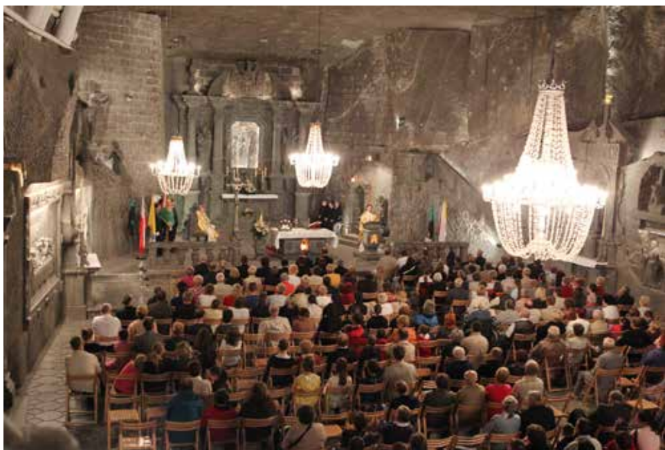
Elke zondag vieren gelovigen de mis in de Sint-Kingakapel, 100 m onder de grond. Zelfs de lusters zouden uit zout zijn vervaardigd.

Wil je een goed beeld van de stad krijgen en de echte sfeer opsnuiven, dan is een dag te kort. In Krakau telt een dag altijd te weinig uren.