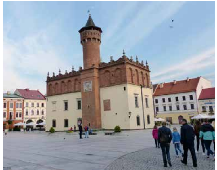
Het 14de-eeuwse stadhuis poseert fier in het centrum op het marktplein van Tarnow.