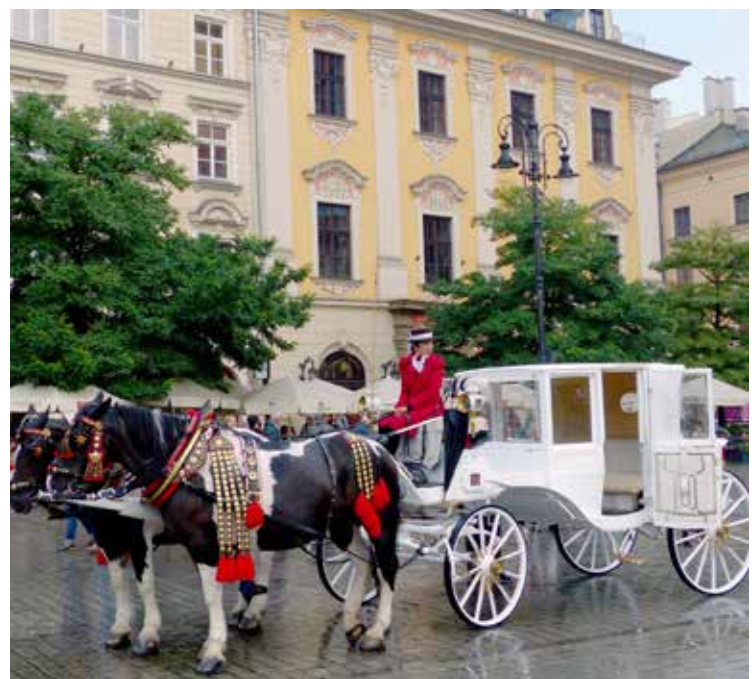
Wil je jezelf eens belangrijk voelen? Stap dan in een van de witte paardenkoetsen en maak een rondje door het oude Krakau.