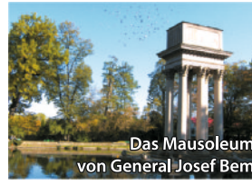
Das Mausoleum von General Josef Bem