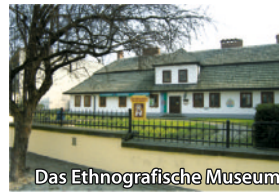
Das Ethnografische Museum