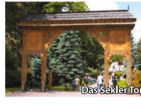
Das Sekler Tor