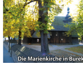
Die Marienkirche in Burek