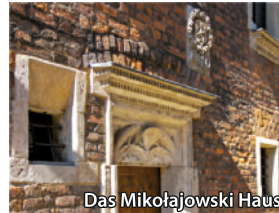
Das Mikołajowski Haus