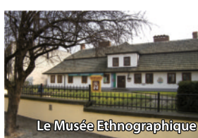
Le Musée Ethnographique