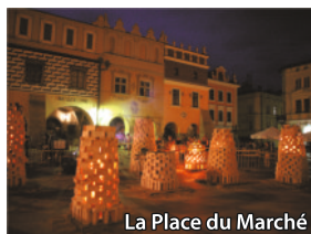
La Place du Marché