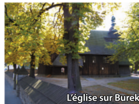
L'église sur Burek