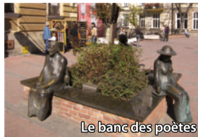
Le banc des poètes