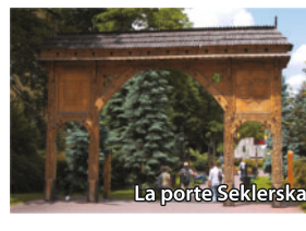
La porte Seklerska