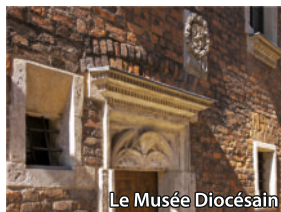
Le Musée Diocésain