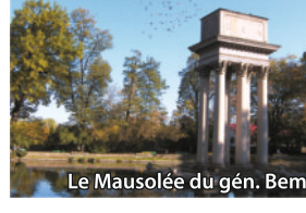
Le Mausolée du gén. Bem