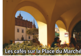
Les cafés sur la Place du Marché