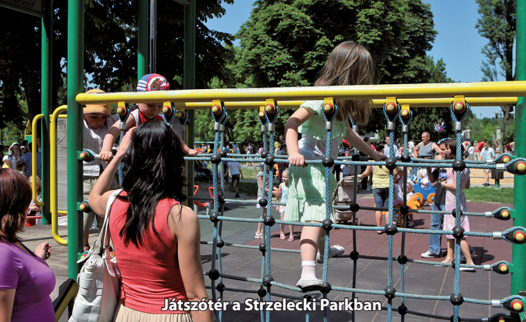
Játszóter a Strzelecki Parkban