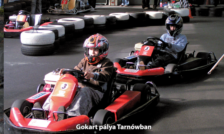
Gokart pálya Tarnówban

Szeretettel várjuk Önöket családi pihenésre Lengyelország legmelegebb városában. Azt garantáljuk, hogy nálunk a gyerekek nem fognak unatkozni, íme a kiválasztott ajánlataink: