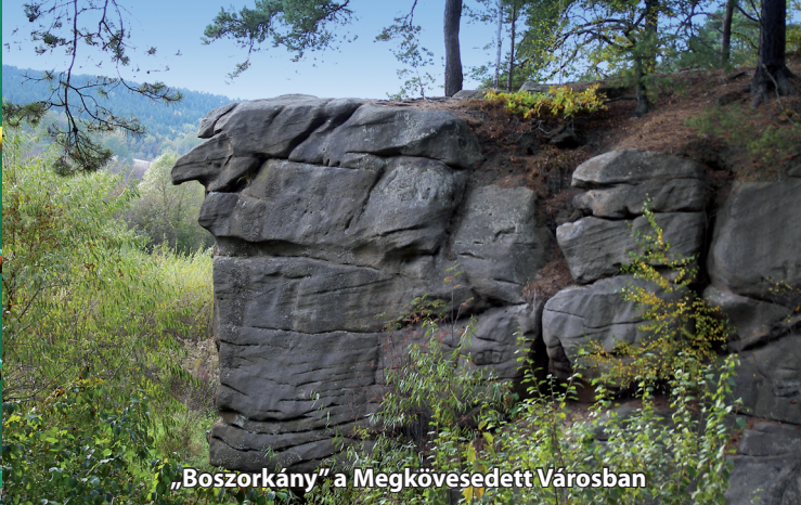
„Boszorkány” a Megkövesedett Városban